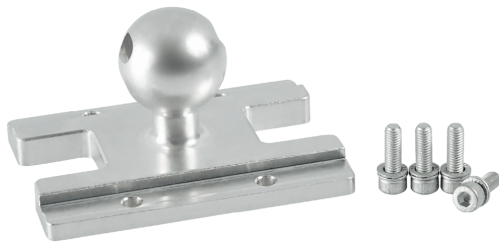
Система держателей магнитный захват SGM-HP/-HT (многократный)